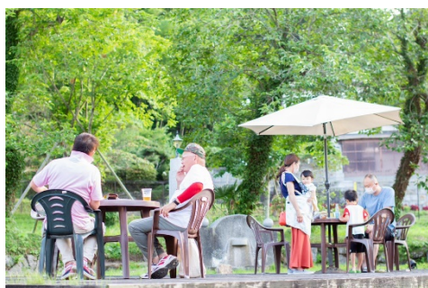
▲齋理屋敷新館エリアでビアガーデン